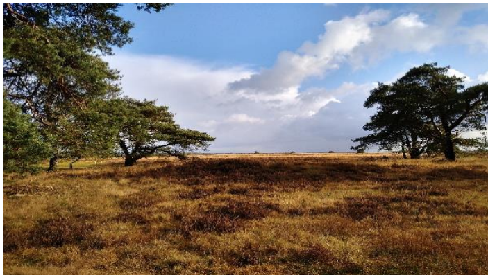
Links: grafheuvel bij Speuld (Veluwe)

Grafheuvels in de Achterhoek en op de Veluwe (bijvoorbeeld op de Ermelose heide en de Ginkelse heide en bij Wolfheze). In het gebied tussen Vaassen en Nierssen liggen grafheuvels heel keurig in een lange lijn van verschillende kilometers. De exacte reden hierachter is nog niet onomstotelijk bewezen. Grafheuvels zijn begravingen uit het laat Neolithicum, de Bronstijd en IJzertijd (ca. 2800 v. Chr. – 200 na Chr.) waar een heuvel bovenop het graf is opgeworpen. Meestal is er een eerste begraving midden in de heuvel waarover de heuvel is opgeworpen, maar vaak werden er later nieuwe doden bijgezet aan de randen van de heuvel waarna de heuvel vaak extra werd opgehoogd. Grafheuvels zijn dus niet de laatste rustplaats van één enkel persoon, maar er kunnen wel 30 personen uit verschillende perioden begraven liggen. Grafheuvels bleven eeuwen in gebruik. Soms werd er bijv. 200 jaar na de eerste begraving opnieuw iemand bij geplaatst. In de latere perioden waren bijzettingen geen inhumaties (uitgestrekte begravingen), maar crematies in een aardewerken urn. De doden kregen ook grafgiften mee zoals aardewerk, bronzen dolken, vuurstenen werktuigen, etc.